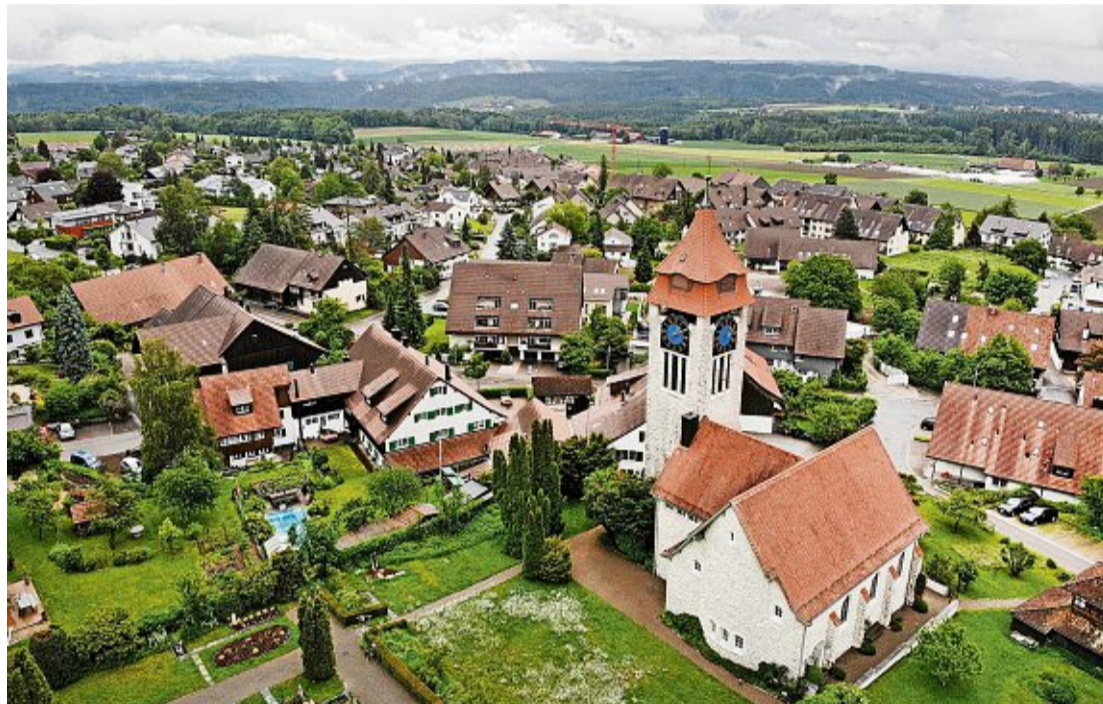
In der Region Winterthur haben die Hauspreise in Brütten am stärksten zugelegt.

Im regionalen Vergleich gehen die Preise aber weit auseinander. Das teuerste Pflaster ist Brütten, hier bezahlt man durchschnittlich 2,11 Millionen Franken für ein Haus. Dahinter liegt die idyllische Oberland-Seegemeinde